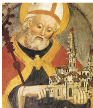
Benedictus in Norcia

Het is maar weinig pelgrims gegeven om hun bedevaart ook echt als een beweging naar binnen te ervaren, als een spirituele ontdekkingstocht die voert naar een binnenkomst op de bronplaatsen bij de mensen die er leven. Een van de wonderen van onze reis was dat we, aangevoerd door een zwierige vader abt, met onze groep overal een hartelijke ontvangst kregen. We werden ontspannen rondgeleid, ook op plaatsen die normaliter – zelfs voor monniken – besloten zijn. Er was soms onderscheid: monniken zongen mee in het koor en de leken in de kerk, de monniken kregen andere plaatsen aan tafel dan de lekengasten, maar dat leidde nooit tot een ongemakkelijk gevoel of een indruk van uitsluiting van een deel van de groep. En we kregen de gelegenheid om met de gemeenschappen in gesprek te gaan en concrete ervaringen uit te wisselen: van zoeken, koesteren, vernieuwen en verbouwen.